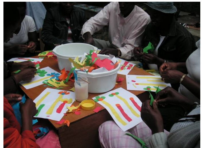
Werkles: Scheuren en plakken, begrip lang en kort

Op het moment dat ik dit stukje schrijf, heb ik nog maar een aantal dagen lesgegeven. Er komen er nog vele bij. Wat een plezier hebben we al met elkaar gehad en wat zijn de leerkrachten trots als ze iets moois hebben gemaakt. Velen zitten op het puntje van hun stoel om te zien wat er komt. Het is net een klas vol nieuwsgierige kinderen. Wat dat betreft is het geweldig om dit te zien. Aan het eind van de eerste week heb ik alle leerkrachten een stickertje uitgedeeld omdat ze zo goed gewerkt hebben. Die werden vol trots op hun hand of schrift geplakt. Dit geeft al veel aan van het verschil tussen Haiti en Nederland. Veel van mijn ervaringen staan op de website van de stichting. Ik hoop hier in de komende tijd nog veel plezier te hebben.