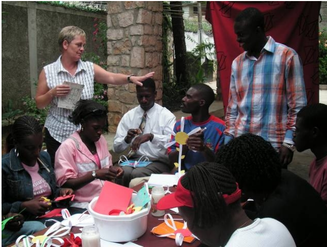
Werkles: bloemen knippen en plakken

Wat hebben ze hier weinig en wat kunnen ze hier weinig en wat is onderwijs toch belangrijk om verder te komen in het leven.