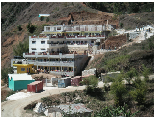
Ka-Blain, de school in maart 2011.