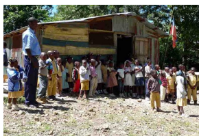
School in Godinot