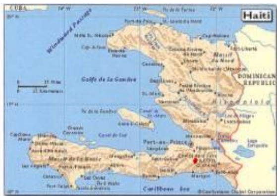
Kenscoff - Godinot - Furcy

Rabobank Westerbork Bankrekening 36.94.66.500 t.n.v. SNSiH