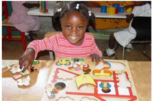
meisje speelt met geschonken materiaal

partnerorganisatie, Quisqueya Universiteit, in Haïti heeft. Wij willen de kosten van de verscheping uiteraard weer zo laag mogelijk houden. In de tweede container is nog ruimte voor spulletjes (schoolspullen, kinderkleding, schoenen, goed en sterk speelgoed enz. enz.). Omdat de container voor ons niet elk moment te vullen is, zoeken wij ruimte waar wij de verzamelde spullen mogen opslaan voordat we dit naar Muntendam brengen. Hebt u ruimte over in een schuur of garage, wilt u dit dan laten weten aan een van de bestuursleden.