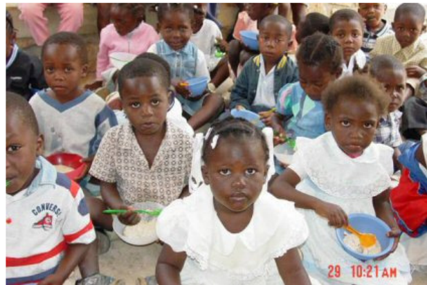
kleuters eten op school in Kenscoff

Algemeen: info@stichtingnaarschoolinhaiti.nl Bestuursleden: voorzitter@stichtingnaarschoolinhaiti.nl secretaris@stichtingnaarschoolinhaiti.nl fondsenwerving@stichtingnaarschoolinhaiti.nl penningmeester@stichtingnaarschoolinhaiti.nl marijkezaalberg@hotmail.com