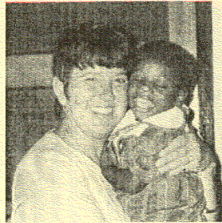
Melkwegje 1, 9441PH Orvelte